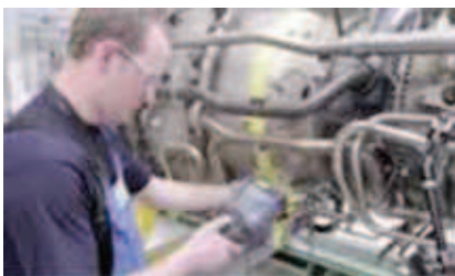
Afbeelding 2: Gasturbine-onderwijs. Een nichemarkt.

Deze vorm van verbreding of verdieping is echter voor veel vragen geen oplossing. Werkgevers zijn meestal niet primair op zoek naar diploma's voor hun medewerkers, zelfs niet naar hele curricula. Ze zoeken vooral kennis en vaardigheden die hun mensen kunnen opdoen om bij te blijven of juist vooruit te lopen op verwachte ontwikkelingen. Medewerkers willen zich graag verdiepen in nieuwe materie, maar een hele studie van enkele jaren met de studiebelasting die daar bij hoort is vaak teveel van het goede. Instellingen voor onderwijs sturen echter vaak op erkende certificaten en eisen volume om opleidingen kostendekkend te kunnen aanbieden. Dat matcht vaak niet. De meeste werkgevers kunnen geen volume bieden. Vooral het Mkb wordt niet bediend. Individuele leer- en ontwikkelvragen kunnen onvoldoende worden beantwoord vanuit het regulier dagonderwijs, ondanks de vele pogingen die daartoe worden gedaan. Het is niet mogelijk voor individuen om te 'shoppen'. De vraag die opdoemt is: kunnen we met alle vernieuwingen die momenteel gaande zijn in het technisch beroepsonderwijs ook voor dit vraagstuk een adequaat antwoord vinden?