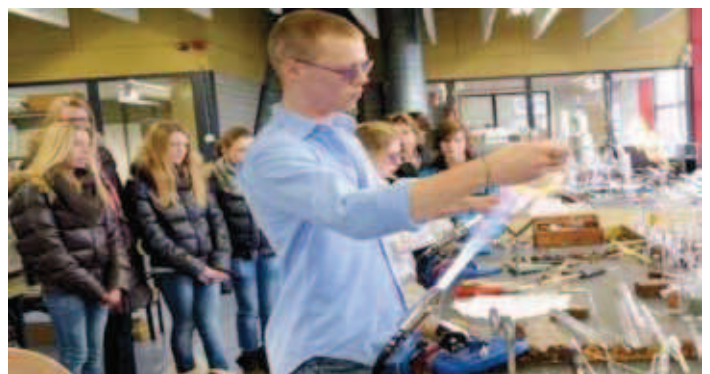
Afbeelding 3: Leidse Instrumentenmakers School (LIS). Modern onderwijs in precisietechnologie met een decennia lange reputatie en samenwerking met industrie en onderzoek.

Gezondheid en technologie kunnen worden gevonden op Hogeschool Zuyd en mechatronica concentreert zich bij vier hogescholen die nauw verbonden zijn met topsector HTSM. Een dergelijk minorenlandschap kan worden uitgebreid met mbo minoren en specialisaties bij de vak- en bedrijfsscholen. Belangrijke voorwaarden zijn dat de minor consequent ieder jaar wordt aangeboden, een co-productie is tussen scholen en bedrijven en een stevige marketing om dit beeld te laten landen en incuberen. De individuele medewerker moet kunnen shoppen uit een breed palet van mogelijkheden.